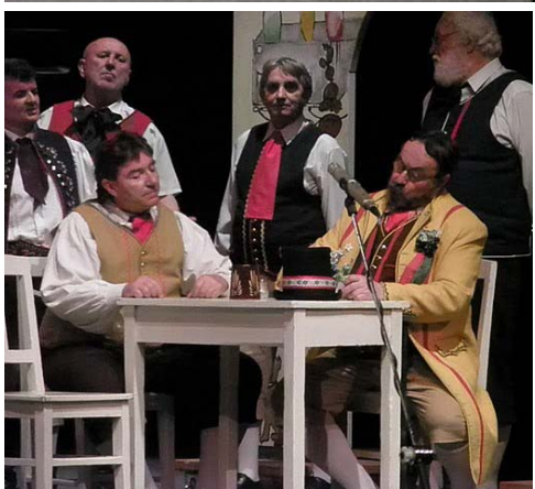
Z provedení Prodané nevěsty v Salesiánském divadle 19.3.2011