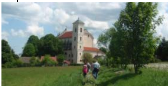
Výlet ke kostelu Nejsvětější Trojice

Na začátku srpna se jedeme soustředit na Šumavu, kde budeme bydlet v Hojsově Stráži. Tam budeme trénovat podzimní a zimní repertoár. Už se nemůžu dočkat.