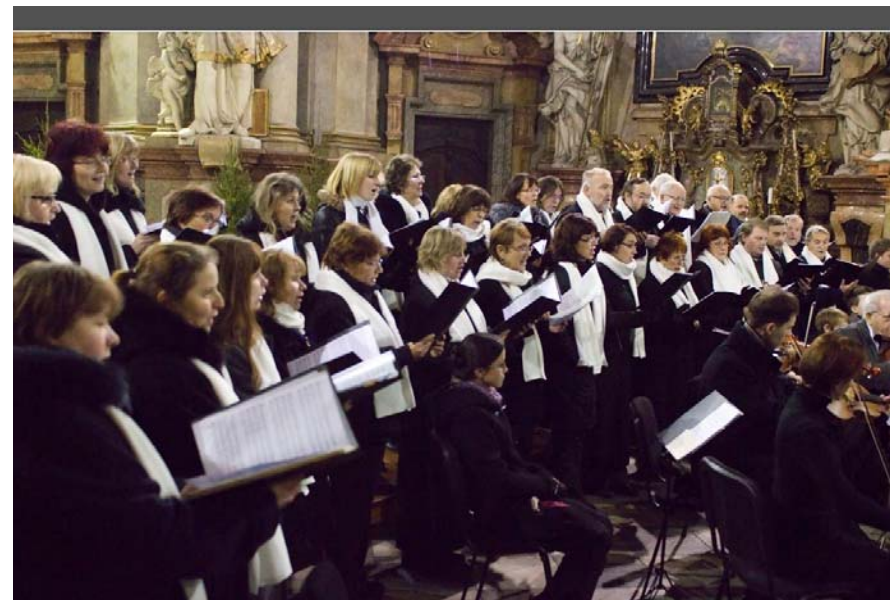
Rybova Vánoční mše v Kostele sv. Mikuláše na Malé straně