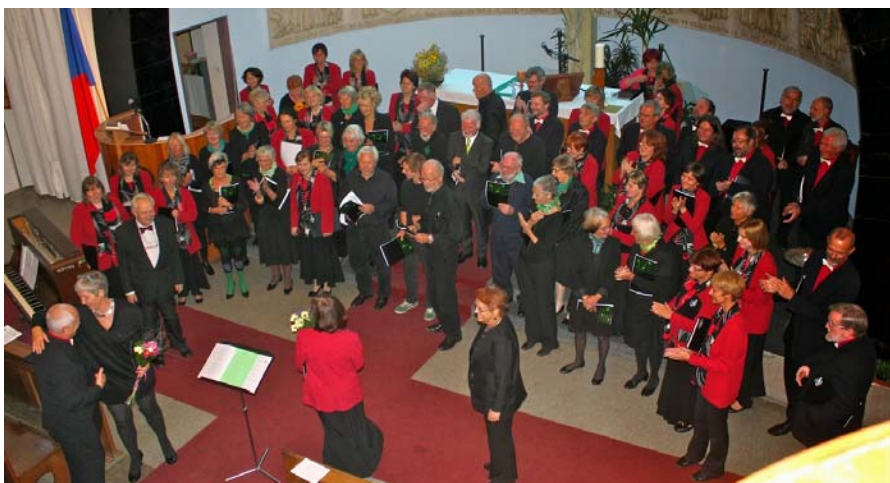
Společně se sborem Ramlosekoret v kostele CČSH ve Farského ulici