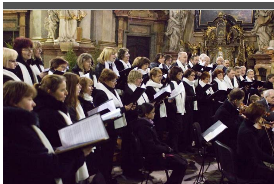
Rybova Vánoční mše v Kostele sv. Mikuláše na Malé straně

26. 12. 2012 Praha 1, kostel sv. Mikuláše, J. J. Ryba: Vánoční mše Hej mistře, dirig. M. Valášek