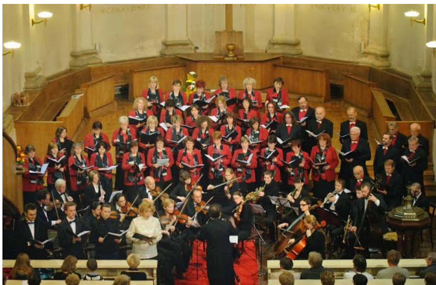
Koncert k 25. výročí Gaudia „U Salvátora“

Náš sbor Gaudium opět dokázal, že je jednou velkou rodinou, kde se mají všichni rádi, pro společnou věc dokážou prakticky cokoli a že je nám všem spolu prostě dobře. Proto vzhůru do dalšího čtvrtstoletí a ať je nám spolu pořád tak hezky, jako dosud!