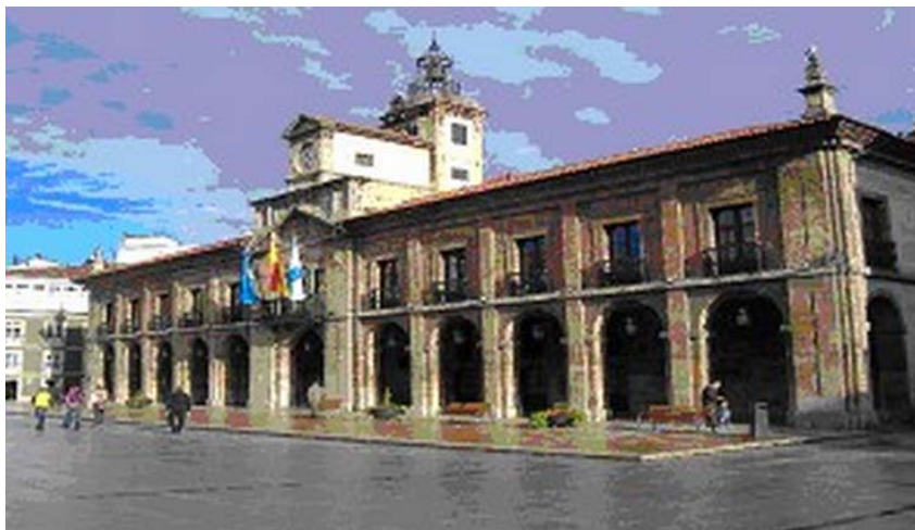
Divadlo v Avilés