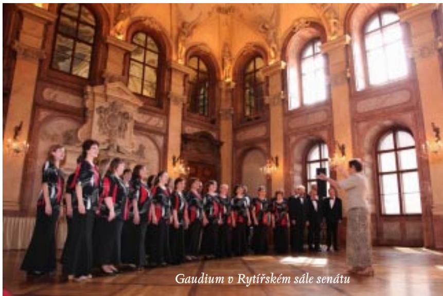
Gaudium v Rytířském sále senátu

bývá většinou restaurace pochybné pověsti, kde silní jedinci sboru znovu řeší všechna úskalí zkoušek, koncertů a zájezdů, kde sbormistr přemýšlí o tom, jak co nejefektivněji odejít z tohoto světa a ostatní se zapřísahají, že již více do kolektivu zpěváků nepáchnou. Nezbyvá než se obrátit na posledního pomocníka a zachránce, tedy humor a zpěv, a jeho prostřednictvím hledat znovu a znovu dobrou náladu a chuť do další práce.