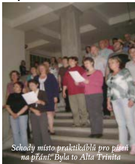
Schody místo praktikáblů pro píseň na přání. Byla to Alta Trinita