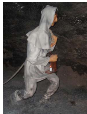
Wieliczka z interieru muzea