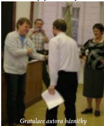
Gratulace autora básničky