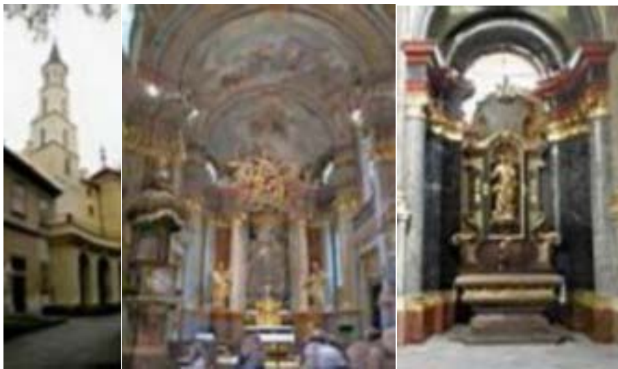
Kostel Sv. Kateřiny, interiéry i exteriery