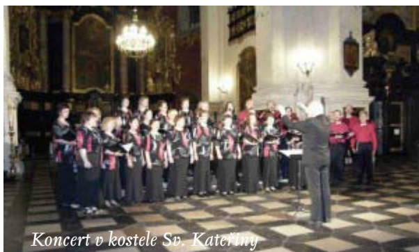
Koncert v kostele Sv. Kateřiny

bami v průběhu mše, kdy jsme se posluchačům skrývali na kůru, poslěze pak před oltářem s asi půlhodinovým samostatným zpíváním námi vybraných skladeb. Spolu s Maďary, kteří zazpívali po nás, jsme potom předvedli Mozartovo Ave verum.