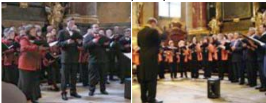
Gaudium zpívá Schubertovu mši