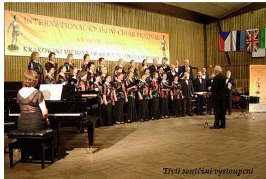
Třetí soutěžní vystoupení

obsazená kategorie byla pro smíšené sbory dospělých s libovolnou repertoárovou volbou. Jako první se představila naše skupinka v krásném sále hudební školy v programu, který začal ve 13 hodin. Dopoledne jsme využili možnosti malé zkoušky s „obhlídkou terénu“. Žel ani jsme si nemohli poslechnout většinu svých „soupeřů“. Museli jsme odjet ke kostelu sv. Petra a Pavla, kde v 18,45 začala soutěž pro celý sbor v kategorii muziky sakrální. A i zde byla malá zkouška předem žádoucí. Třetí naše soutěžní vystoupení bylo v kategorii smíšených dospěláků. To se uskutečnilo následující den, tedy v sobotu opět v onom hezkém sále hudební školy, vyzdobeném velikým transparentním plátnem s nápisem Krakowski Międzynarodowy Festival Chóralny , visící nad celým jevištěm. Po straně jeviště byly v řadě vlajky všech zúčastněných národů. Soutěžní utkání začalo v 11 hodin, my jsme se dostali na řadu po 13 hodině. Ani tady nás pořadatelé nenechali dlouho vyposlechnout si ostatní zúčastněné, protože nám vyjednali samostatný (označovaný jako doplňkový) koncert v kostele Sv. Pavla Apoštola v asi 20 km vzdálené Bochni. Mezi tím jsme ale neodolali pokušení podívat se také na slavný královský Wawel. V Bochni jsme se o přízeň posluchačů dělili s maďarským sborem Dél-Pesti Sonore Vegyeskar nejprve dvěma sklad