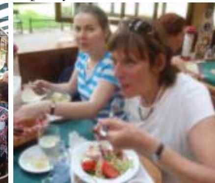
I posilit je potřeba