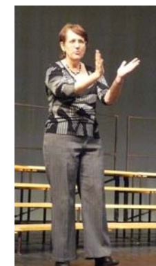
.....a naší Zdeny