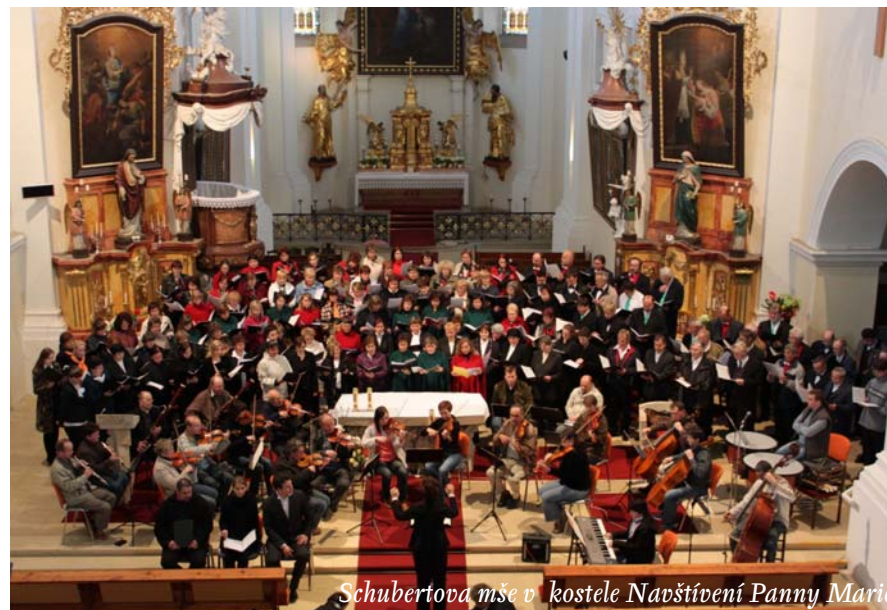
Schubertova mše v kostele Navštívení Panny Marie