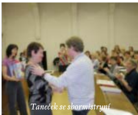
Taneček se sbormistryní