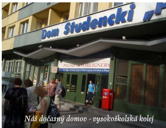
Náš dočasný domov - vysokoškolská kolej

A jak už to v životě bývá, všechno má svůj konec. Nastalo poslední Sbohem Krakove a návrat do Prahy. Dorazili jsme v časných ranních hodinách. Metro ani ještě nejezdilo a tak jsme se museli svěřit nočním tramvajím a autobusům pro šťastný návrat domů.