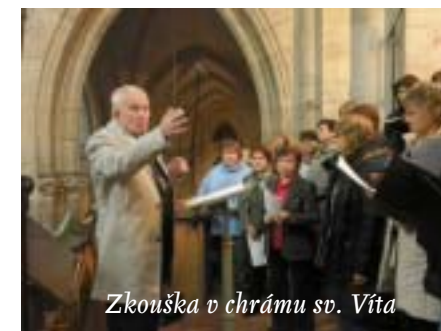
Zkouška v chrámu sv. Víta

To se konalo v Dobronicích u Bechyně, ve výcvikovém středisku Univerzity Karlovy. Přesto, že na rozdíl od předchozího roku, kdy nám celé soustředění propršelo, bylo krásně a sluníčko svítilo od rána do večera, kdy ho vystřídala záplava hvězd, Gaudium doslova dřelo. Tedy to torzo, které do Dobronic dorazilo – spousta lidí na soustředění tak nějak zapoměla, naplánovala si něco jiného (nebo jí bylo naplánováno, většina za to jistě moc nemohla), prostě nás tam bylo málo. Provedení Fibicha se blížilo, takže jsme s Vládou „leštili“. A kromě toho jsme ve velkém najeli na opery. „Toreador“ a „La fumée“ z Carmen, „Zingarelle“ a „Matadoři“ z La Traviata nám zněly v hlavě od rána do večera. V neděli po obědě jsme dokonce měli pocit, že už nám to docela jde. Jenže tady byla ještě ta nahrávka, kterou nám Zde-