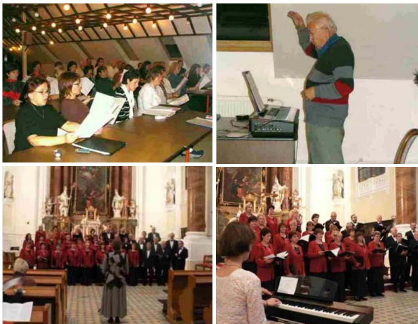
Obrázky ze zkoušky a z koncertu

Vlastní koncert se uskutečnil v neděli v kostele Nanebevzetí Blahoslavené Panny Marie a jeho program byl přirozeně věnován duchovní hudbě. Zazpívali jsme zde tyto skladby: