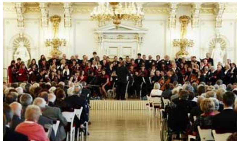
Společné vystoupení se sborem ČVUT Praha ve Španělském sále Pražského hradu