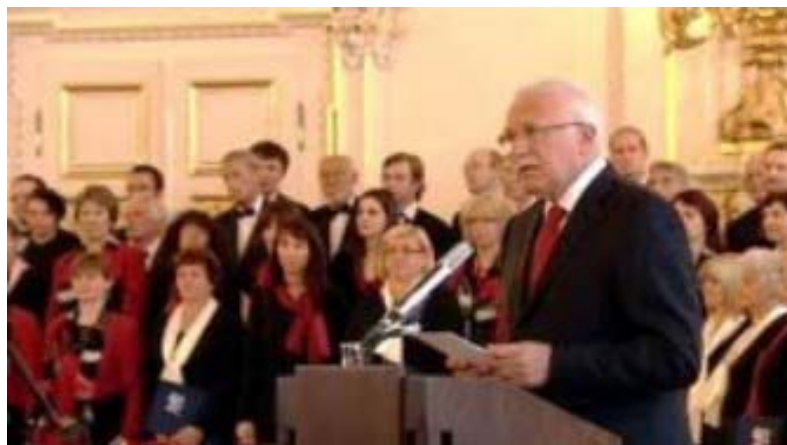
Při projevu pana prezidenta