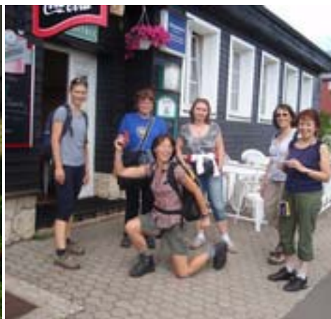
Na Pomezních boudách, část altíků a jedna tenorka