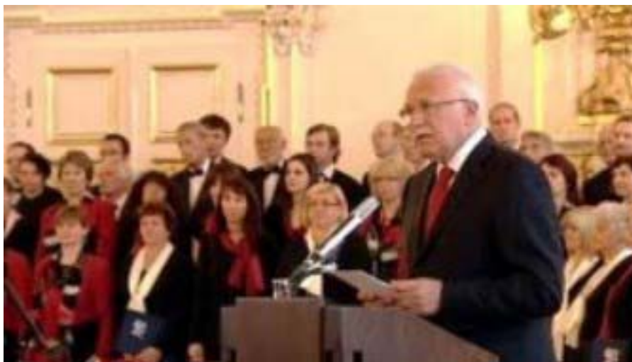
Při projevu pana prezidenta