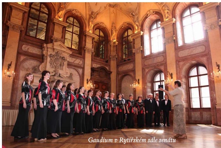
Gaudium v Rytířském sále senátu

bývá většinou restaurace pochybné pověsti, kde silní jedinci sboru znovu řeší všechna úskalí zkoušek, koncertů a zájezdů, kde sbormistr přemýšlí o tom, jak co nejefektivněji odejít z tohoto světa a ostatní se zapřísahají, že již více do kolektivu zpěváků nepáchnou. Nezbyvá než se obrátit na posledního pomocníka a zachránce, tedy humor a zpěv, a jeho prostřednictvím hledat znovu a znovu dobrou náladu a chuť do další práce.