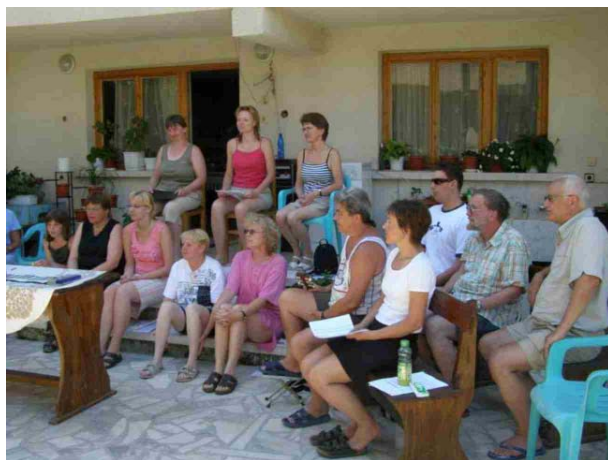
Zkouška na dvorečku penzionu