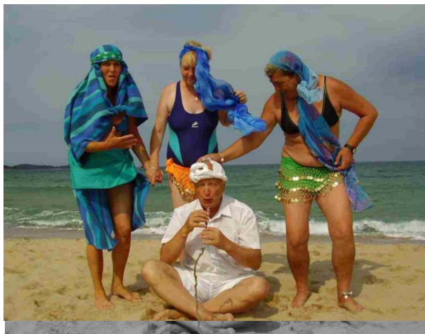
Masky na pláži