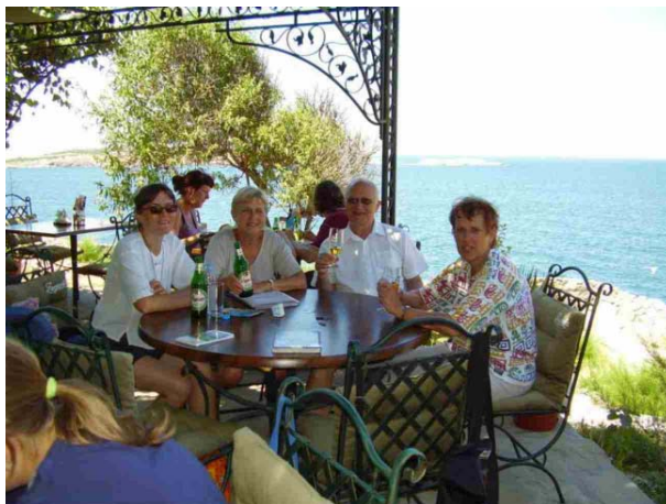
Siesta na terase penzionu